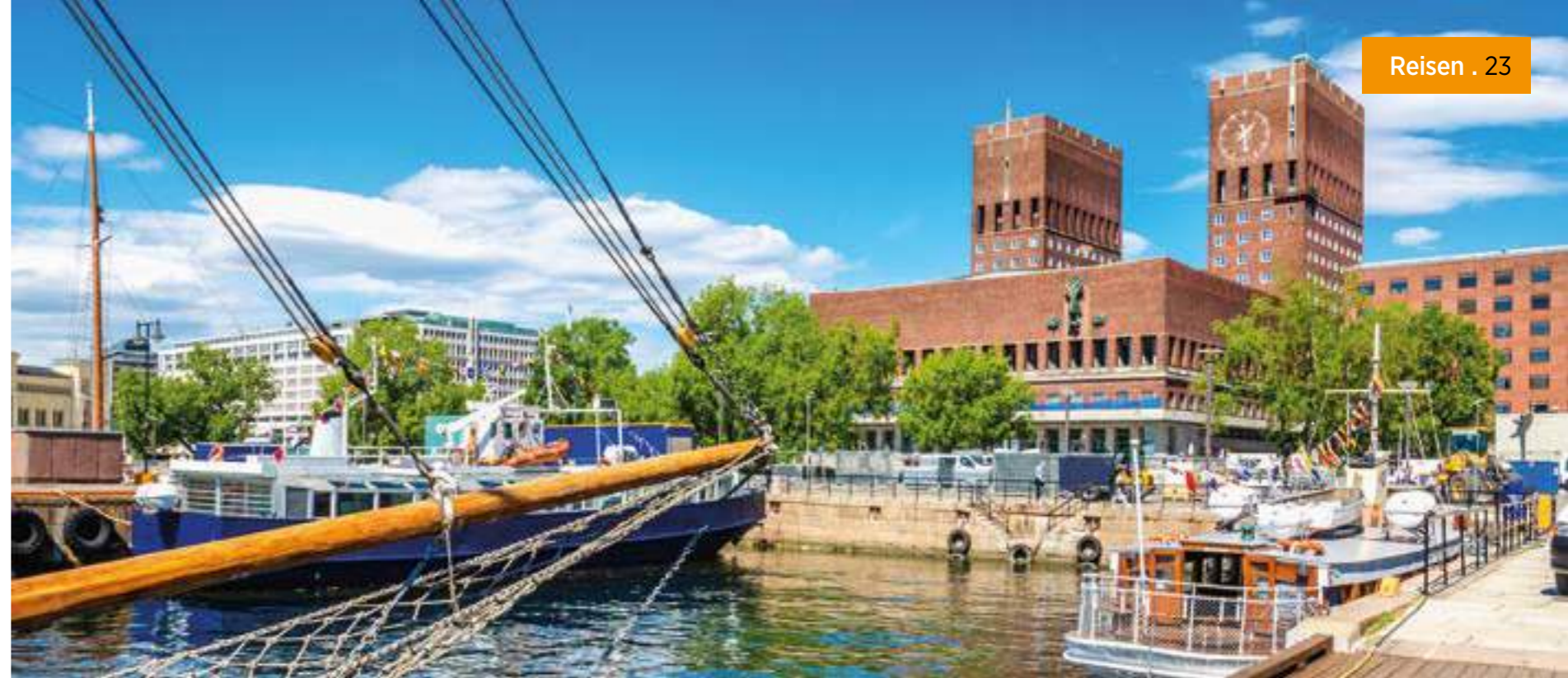
Repräsentatives Rathaus von Oslo mit Hafepromenade

Ganz im Westen der Promenade geht es im Viertel Filipstad mit seinem riesigen Indoor-Skaterpark eher sportlich zu, im angrenzenden Stadtviertel Tjuvholmen steht die Kunst im Mittelpunkt – unter anderem befindet sich hier das vom Meisterarchitekten Renzo Piano entworfene Astrup Fearnley Museum mit einer bedeutenden Sammlung moderner und zeitgenössischer Kunst. Weiter geht es nach Aker Brygge, wo altherwürdige Werftgebäude auf moderne Architektur treffen, und wo es sich hervorragend shoppen, essen und flanieren lässt. Auf der Halbinsel Akersneset