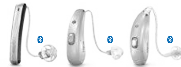
Styletto Connect Pure Charge&Go Motion Charge&Go

Entspannen Sie - Ihre Hörgeräte powern weiter. Signia Hörgeräte mit Lithium-Ionen-Akku und Bluetooth®.