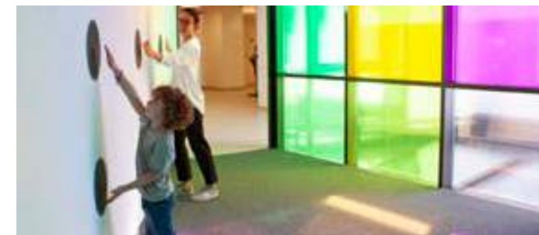
Im Audioversum wird Hören zum Abenteuer

Hör- und Erlebnisweg: www.pro-audio-uri.ch/hoer-und-erlebnisweg/