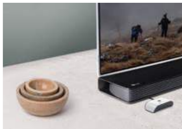
Maxi Pro TV-Streamer

Maxi Pro hilft Ihnen auch, Gesprächen zu folgen. Einfach auf dem Tisch platzieren und die Lautstärke den eigenen Bedürfnissen anpassen – das Gespräch wird klar übertragen. Sie haben die Wahl, ob Sie eine unserer Kopfhörerlösungen oder auch die Induktionsschlinge als Ergänzung für Hörgeräteträger nutzen möchten.