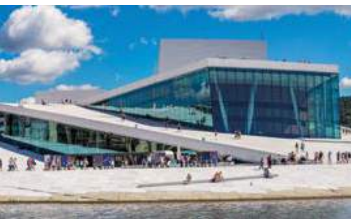
Spektakuläre Architektur: Opernhaus und Skyline „Barcode“

Weitere Informationen finden Sie unter: www.visitoslo.com/de